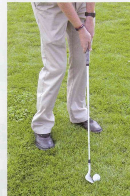
Hände sind im Treffmoment leicht vor dem Schlägerkopf