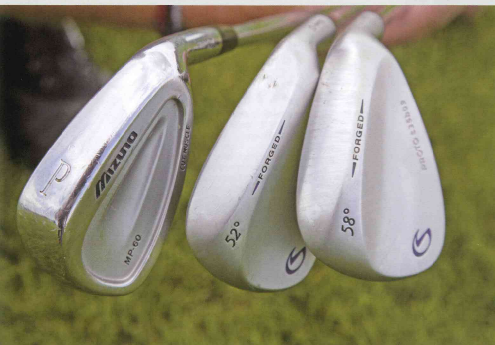
Die richtige Schlägerwahl stellt den ersten und zudem ausgesprochen wichtigen Schritt beim Pitch dar.