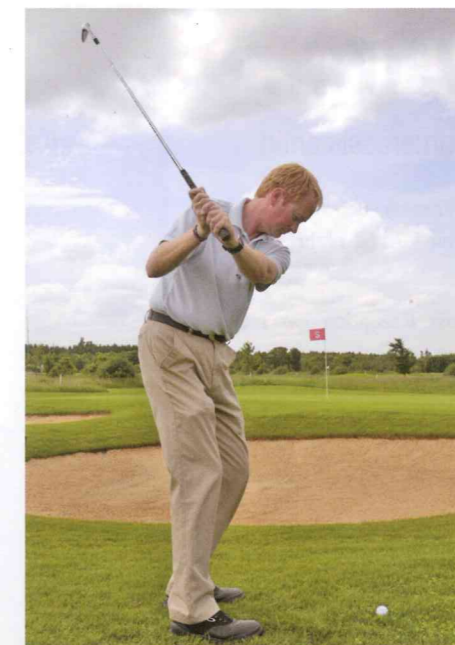
Schlägerblatt ist leicht offen